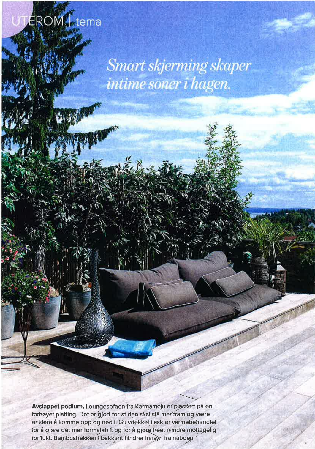
Avslappet podium. Loungesofaen fra Karmameju er plassert på en forhøyet plattform. Det er gjort for at den skal stå mer fram og være enklere å komme opp og ned i. Gulvdekket i ask er varmebehandlet for å gjøre det mer formstabil og for å gjøre treet mindre mottagelig for fukt. Bambushekkén i bakkant hindrer innsyn fra naboen.

Taket er laget av spiler i tre, og oppå dem ligger et dekke av klar plast. Dette slipper lyset gjennom på en behagelig måte. Ved takutspringet er det montert varmeelementer, så man kan sitte ute selv når temperaturen synker.