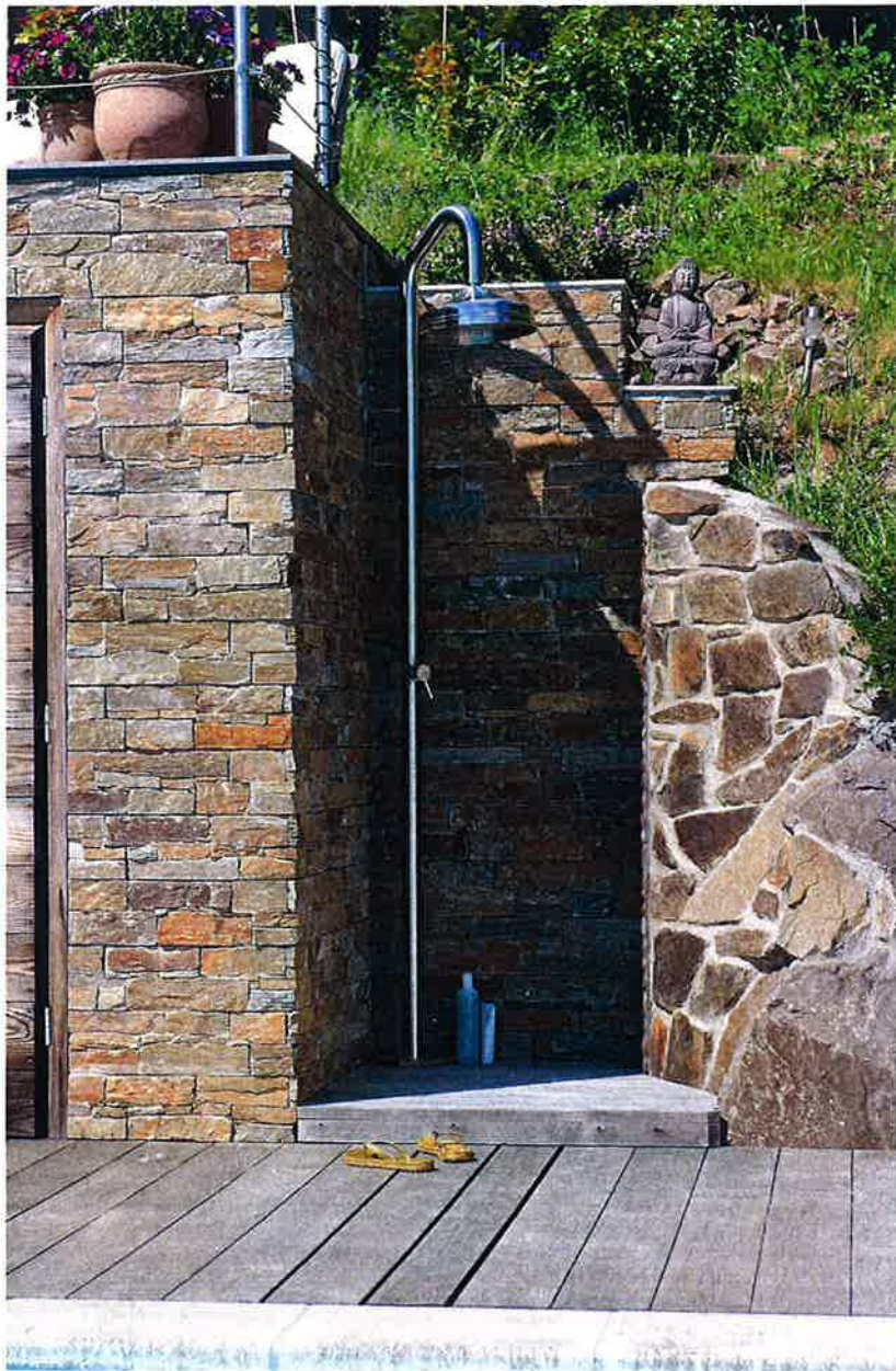
Ren i det fri. Utedusjen er plassert i en nisje av naturstein og tørrmur. Til venstre i bildet kan du skimte et skap, praktisk for oppbevaring til ting som ikke tåler en norsk sommer. På platået over ligger solplatingen.