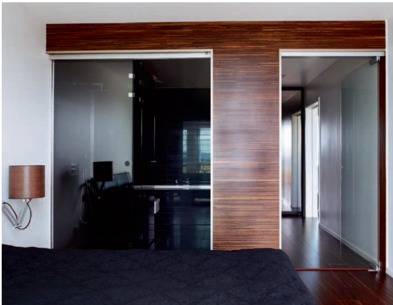
Egen suite. Arealet til høyre var opprinnelig bare gangareal. Nå er det integrert i badet. Den sotede dusjveggen demper følelsen av å være eksponert mot soverommet. Den mørkbeisede bambusparketten fra bambus.no er brukt som veggkledning og utgjør en kontrast til badets glatte overflater.

L a oss like godt bli ferdige med ulempene først. For å komme til soverommet, må du først gjennom badet. Og når du står i dusjen, eller sitter på do, er du på utstilling for den som måtte befinne seg i sengen. Løsningen er ikke helt ulik den man kan finne på en del nye hoteller – kanskje for å kunne selge flere enkeltrom. Dette badet befinner seg, ganske riktig, i en singelleilighet.